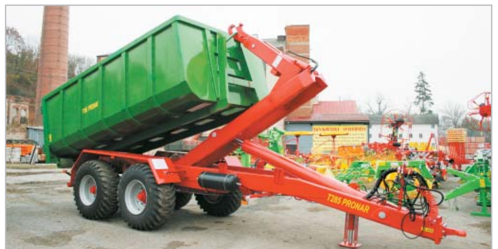
Nosič kontejnerů T 285 s nosností 16,5 tuny