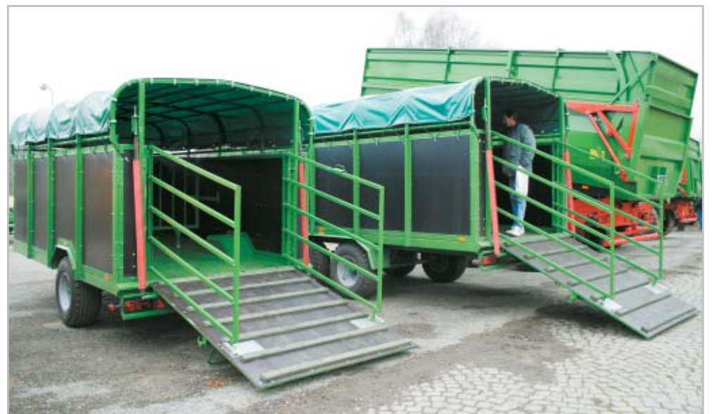
Přepravníky zvířat Kurier 6 a 10 budou v roce 2010 doplněny o model s hydraulicky spouštěným podvozkem v celokovovém provedení

Menší má čtyři a větší šest rotorů osazených sedmi pracovními rameny s olejovými převodovkami firmy Comer. Obrabeče mají požadavek na minimální výkon traktoru 37, respektive 44 k. Shrnovače ZKP se vyrábějí ve třech pracovních záběrech 3; 3,5 a 4,2 m. Menší dva mají pevné, největší pak aktivní zavěšení. Minimální výkon traktoru se pohybuje od 20 do 30 k. Nabídku doplňuje svi-