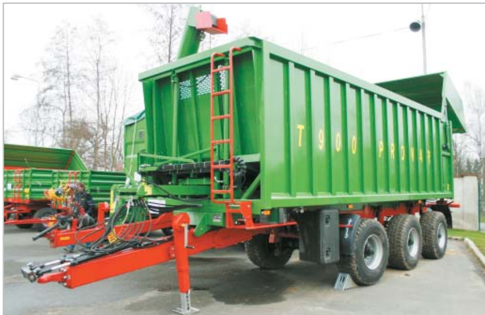
Návěs s výtlačným čelem T 900

jednotlivých skupin jsou vlastní multiregionální. Hlavní a pro vlastní provoz traktoru stěžejní díly jsou od renomovaných výrobců. Polského původu jsou například disky kol, kabina či kapota. Motory do jednotlivých typů dodává Iveco (80 a 100 k) a Deutz (140; 180 a 265 k). Tyto motory s turbodmychadlem a vnitřním chlazením splňují nejpřísnější ekologické limity (EUR III). K plnému komfortu práce přispívá plně synchronizovaná