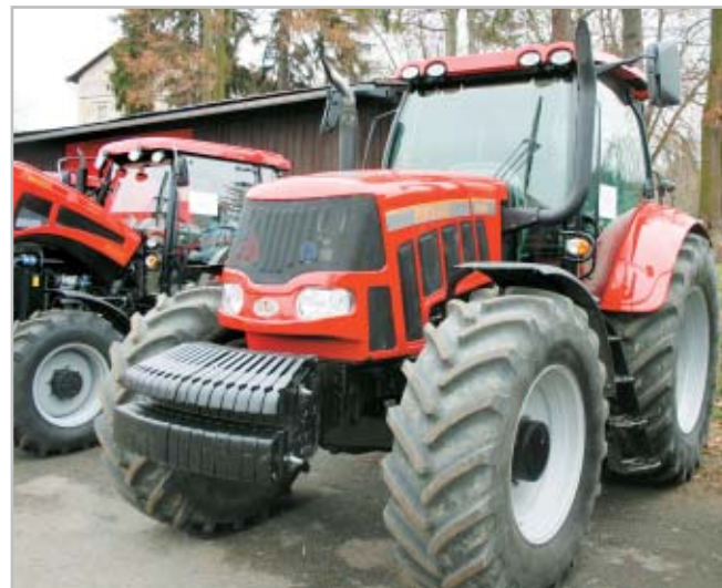
Traktory Pronar prošly nejdříve náročnými předprodejními testy

nostranným nebo až třístranným sklápěním. K dispozici jsou spodní, horní, otočné a K80 závěsy. Stroje jsou vybaveny nápravami ADR a BTW a brzdami Knorr či Haldex. Bočnice pocházejí z Pronaru nebo Fuhrmanna. Valníky mají volitelné otevírání bočnic – kolem horního i spodního čepu, vcelku nebo zvlášť. Bočnice jsou